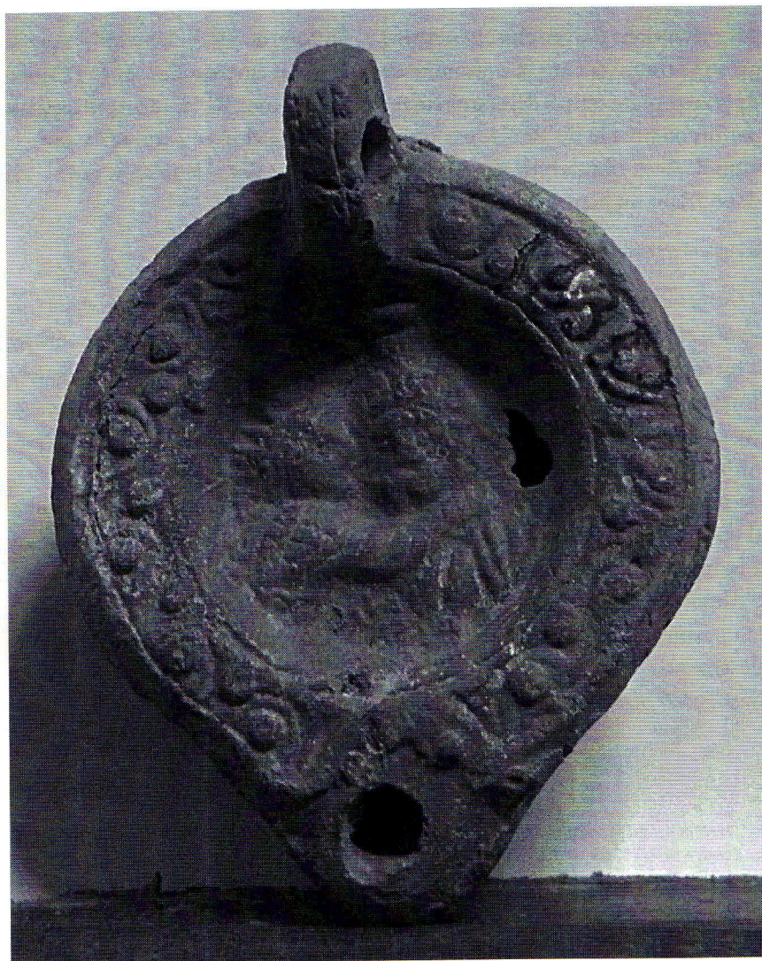
Fig. 1. Le baiser d'Hélios à Sarapis. Alexandrie, Musée gréco-romain, Inv. 16333.