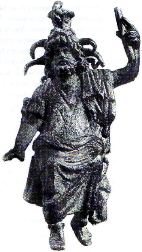
Fig. 2. Sarapis-Hélios trônant. Musée du Louvre, Département des Antiquités grecques et romaines, N 5401. D'après W. Hornbostel, Sarapis. Studien zur Überlieferungsgeschichte, den Erscheinungsformen und Wandlungen der Gestalt eines Gottes , Leiden, 1973, pl. XCV, p. 463, fig. 162

British Museum, représente Sarapis trônant, radié, avec la main gauche levée tenant une haste et la main droite baissée, posée au-dessus du chien Cerbère (fig. 3) 51 . Symétriquement à Cerbère, de l'autre côté du trône, se trouve un aigle. Il semble donc qu'on ait ici ajouté à la représentation canonique alexandrine l'animal jovien.