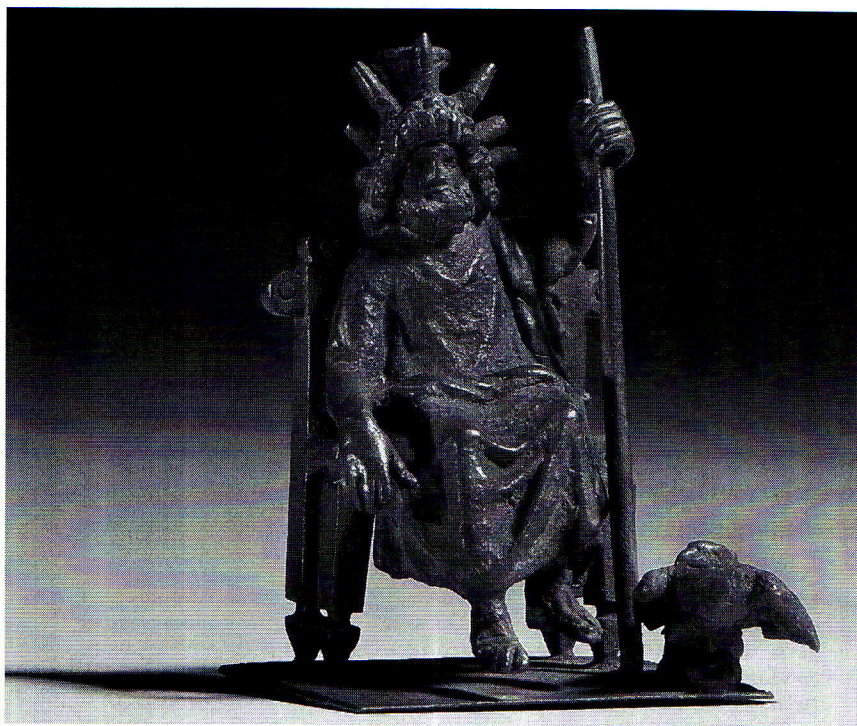
Fig. 3. Zeus Hélios Megas Sarapis (?) trônant. Londres, British Museum, Department of Greek and Roman Antiquities, Inv. Walters 939.

Les documents que nous mentionnons ici, élaborés dans la région d'Alexandrie, attestent qu'à partir d'Hadrien, des copies à petite échelle de la statue cultuelle furent façonnées, qui intégraient la nature solaire du dieu. Sur ces statuette, Sarapis est couronné de rayons à l'instar d'Hélios et parfois accompagné de l'animal emblématique de Zeus, l'aigle. Il pourrait donc s'agir de Zeus Hélios Megas Sarapis.