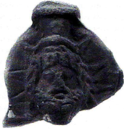
Fig. 4. Zeus Hélios (Megas Sarapis?) trônant. Paris, Musée du Louvre, AF 1289. D'après F. Dunand, Catalogue des terres cuites du Louvre , Paris, RMN, 1990, p. 171, fig. 466

l'époque d'Hadrien dans les garnisons romaines. En effet, une inscription d'Antinoé célèbre l'ouverture de la Via Nova Hadriana sous le règne d'Hadrien, ce qui implique là encore la présence de détachements militaires 93 . La dédicace est datée de l'an 21 du règne d'Hadrien, en février 137 apr. J.-C. Elle précise qu'il a « fait creuser la nouvelle voie Hadrienne, de Bérénikè à Antinooupolis, à travers des régions sûres et plates, et l'a munie abondamment, de distance en distance, de citernes, de stations et de bastions, l'an 21, le 1 er Phamenoth ».