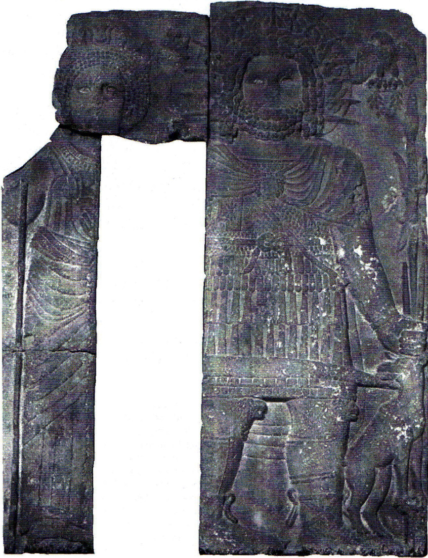
Fig. 5. Antaios et Nephthys. Le Caire, Musée égyptien, CG 27572.

raie au milieu et sa tête est ceinte de la couronne de laurier, nimbée et radiée de quinze rayons. Il porte la tenue d'un officier romain de haut rang : par-dessus sa cuirasse à écailles et sa tunique à manches courtes, un manteau est attaché sur sa poitrine par un gorgoneion ; une ceinture est nouée au niveau de la taille et deux épaulières ornées d'un faisceau de foudres pendent de chaque côté de son cou, sous le manteau. Il est chaussé de sandales à lacets et ses jambes sont protégées par des cnémides à tête de lion dont les attaches sont bien visibles. De la main gauche, il tient une lance à laquelle sont attachés des foudres, liés par un ruban.