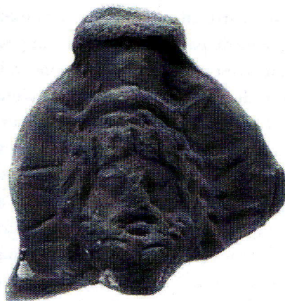
Fig. 4. Zeus Hélios (Megas Sarapis?) trônant. Paris, Musée du Louvre, AF 1289. D'après F. Dunand, Catalogue des terres cuites du Louvre , Paris, RMN, 1990, p. 171, fig. 466

l'époque d'Hadrien dans les garnisons romaines. En effet, une inscription d'Antinoé célèbre l'ouverture de la Via Nova Hadriana sous le règne d'Hadrien, ce qui implique là encore la présence de détachements militaires 93 . La dédicace est datée de l'an 21 du règne d'Hadrien, en février 137 apr. J.-C. Elle précise qu'il a « fait creuser la nouvelle voie Hadrienne, de Bérénikè à Antinooupolis, à travers des régions sûres et plates, et l'a munie abondamment, de distance en distance, de citernes, de stations et de bastions, l'an 21, le 1 er Phamenoth ».