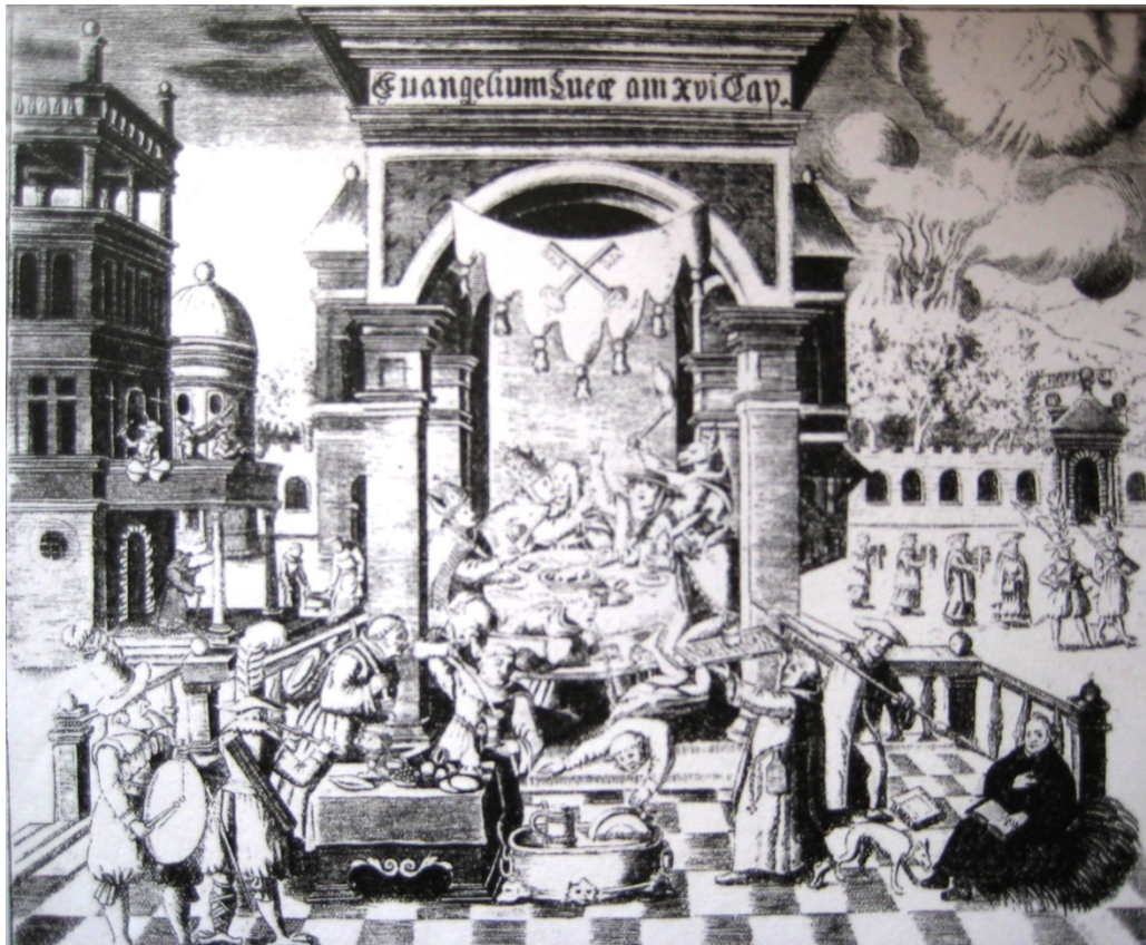
Fig. 3 Staatsbibliothek zu Berlin – Preußischer Kulturbesitz, YA 831 m