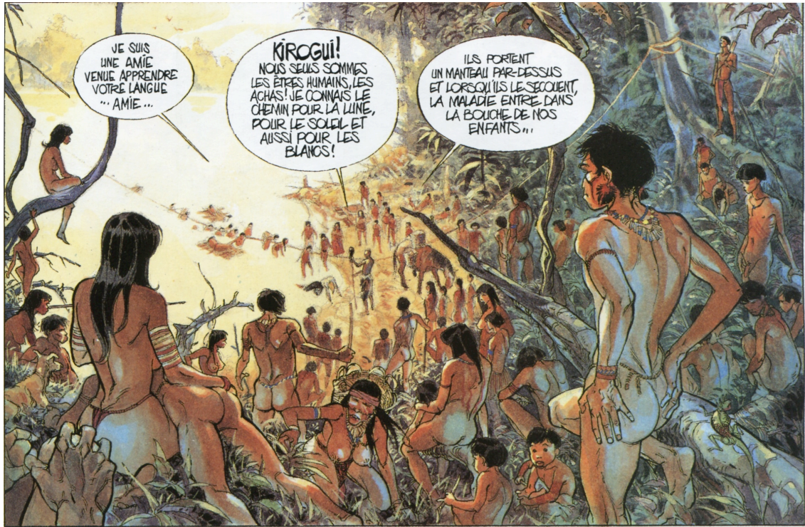
figure 6 : Lepage & Sibran, La Terre sans mal , p. 25

Par exemple dans les fessiers érotiquement parfaits d'une bande dessinée peu fidèle mais très sincère qui rappellent que la nudité des « Bons sauvages » (c'est le titre du chapitre XXII) peut susciter l'écriture sensuelle de l'ethnologue :