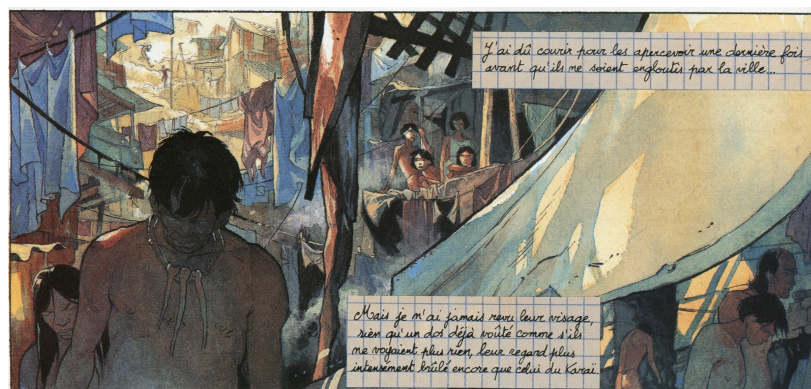
figure 4 : Lepage & Sibran, La Terre sans mal, p. 62

un groupe rebrousse chemin et replonge dans ce qui reste de forêt, réelle ou imaginaire (le dessin se déréalise) ; un autre descend dans le bidonville et s'y fond en abdiquant toute identité (têtes baissées, obscurité envahissant la case) ;