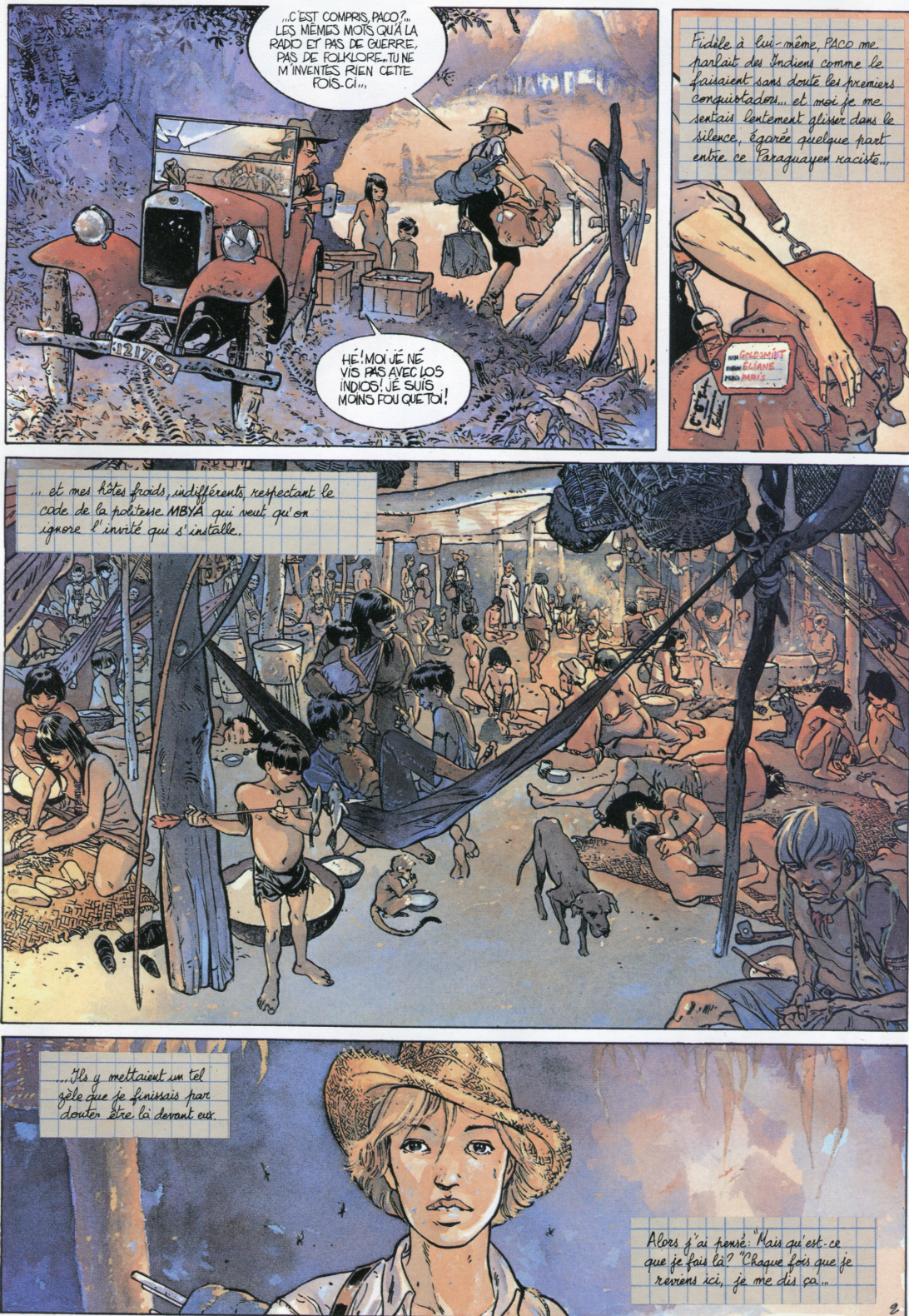
figure 1 : Lepage & Sibran, La Terre sans mal, p. 4

Le ton de l'aventure est réglé par l'alternance de cette voix narrative et des phylactères du dialogue ; mais les dernières planches de l'album, qui reproduisent une sélection de pages du carnet de l'héroïne, opèrent un saut dans le temps, et placent toute l'aventure dans la catégorie