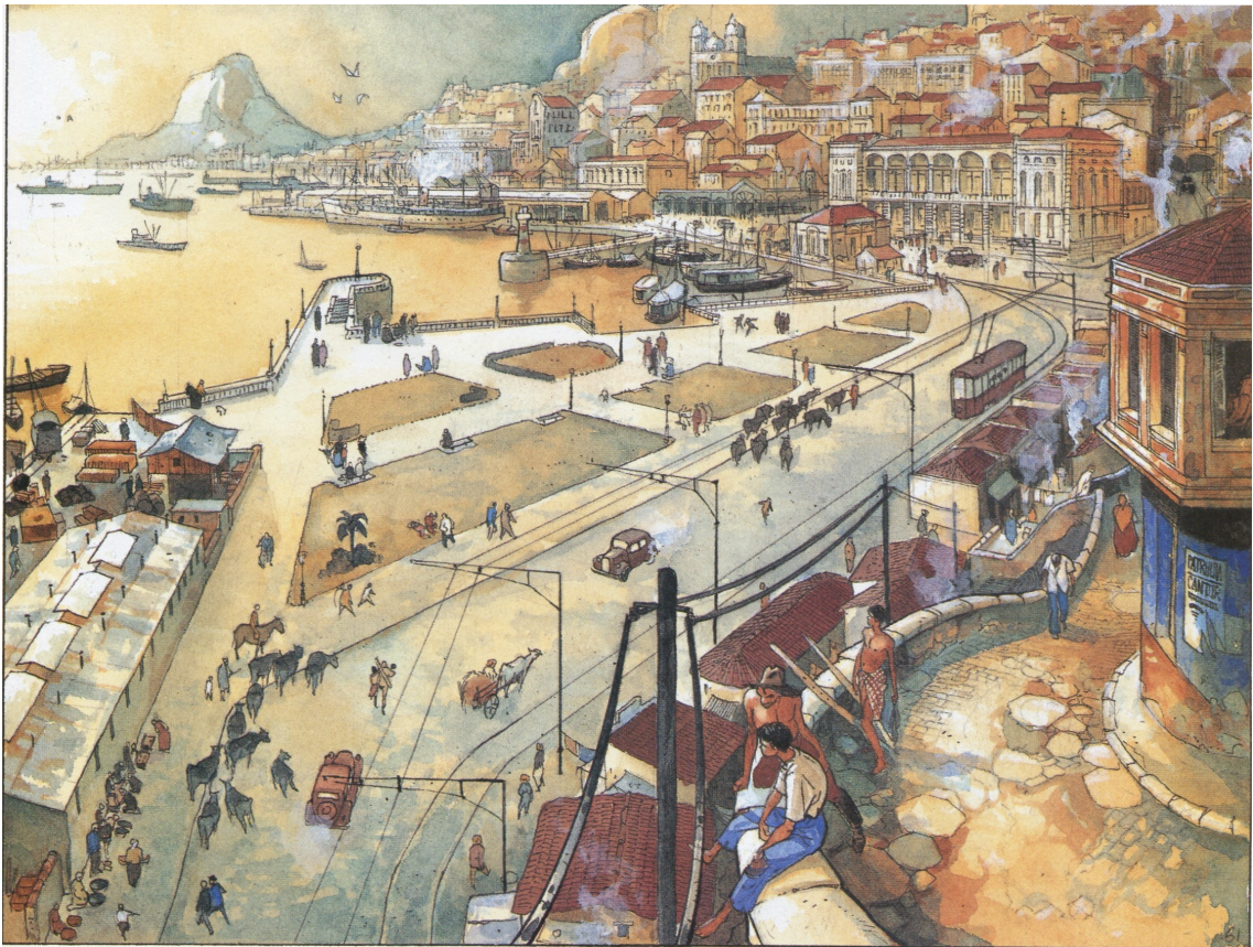
figure 5 : Lepage & Sibran, La Terre sans mal , p. 63

mais l'héroïne, son fils métis et sa jeune compagne au singe s'engagent sur le port. La petite sauvage, voulant vérifier que les dames en robe longue n'ont pas de corps (comme elle en est persuadée), soulève la jupe d'une petite fille et reçoit en retour une gifle bien sentie. Deux cases de taille croissante concluent cette troisième voie et le récit bédéistique : un gros plan très clair, en couleurs chaudes, sur l'éclat de rire des trois personnages ; puis une vue du port, des larges avenues qui y mènent, des animaux qui y côtoient les automobiles, avec un tramway au premier plan, des bateaux au dernier, et une lumière dorée qui vient éclairer les immeubles majestueux qui bordent la courbe du quai.