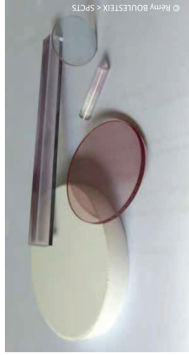
Céramiques transparentes pour lasers. De gauche à droite : "cru" (avant traitement thermique), Barreau de Nd:YAG, disque de Nd:YAG, barreau bicouche de YAG:Nd:YAG, disque de Nd:Lu 2 O 3

* Début 2014, le laboratoire Science des Procédés Céramiques et Traitements de Surface (SPCTS, UMR 7315 Université de Limoges-CNRS-ENSCI) et la société CILAS (Compagnie Industrielle des Lasers) ont associé leurs compétences scientifiques et techniques dans le cadre de la création d'un Laboratoire Commun de Recherche intitulé « Laboratoire des Céramiques Transparentes pour application Laser » (LCTL). Il conçoit et étudie les propriétés de céramiques transparentes pour des applications photoniques. Ce laboratoire, installé dans les locaux du SPTS sur le site du Centre Européen de la Céramique, élabore ces nouvelles céramiques par un procédé développé et optimisé depuis une dizaine d'années.