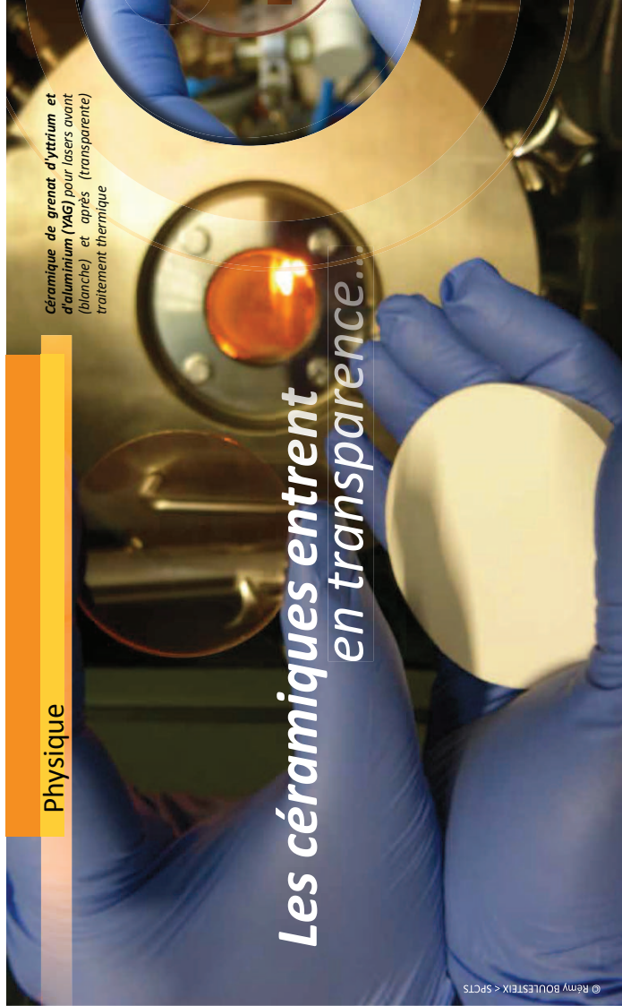
Céramique de grenat d'yttrium et d'aluminium (YAG) pour lasers avant (blanche) et après (transparente) traitement thermique