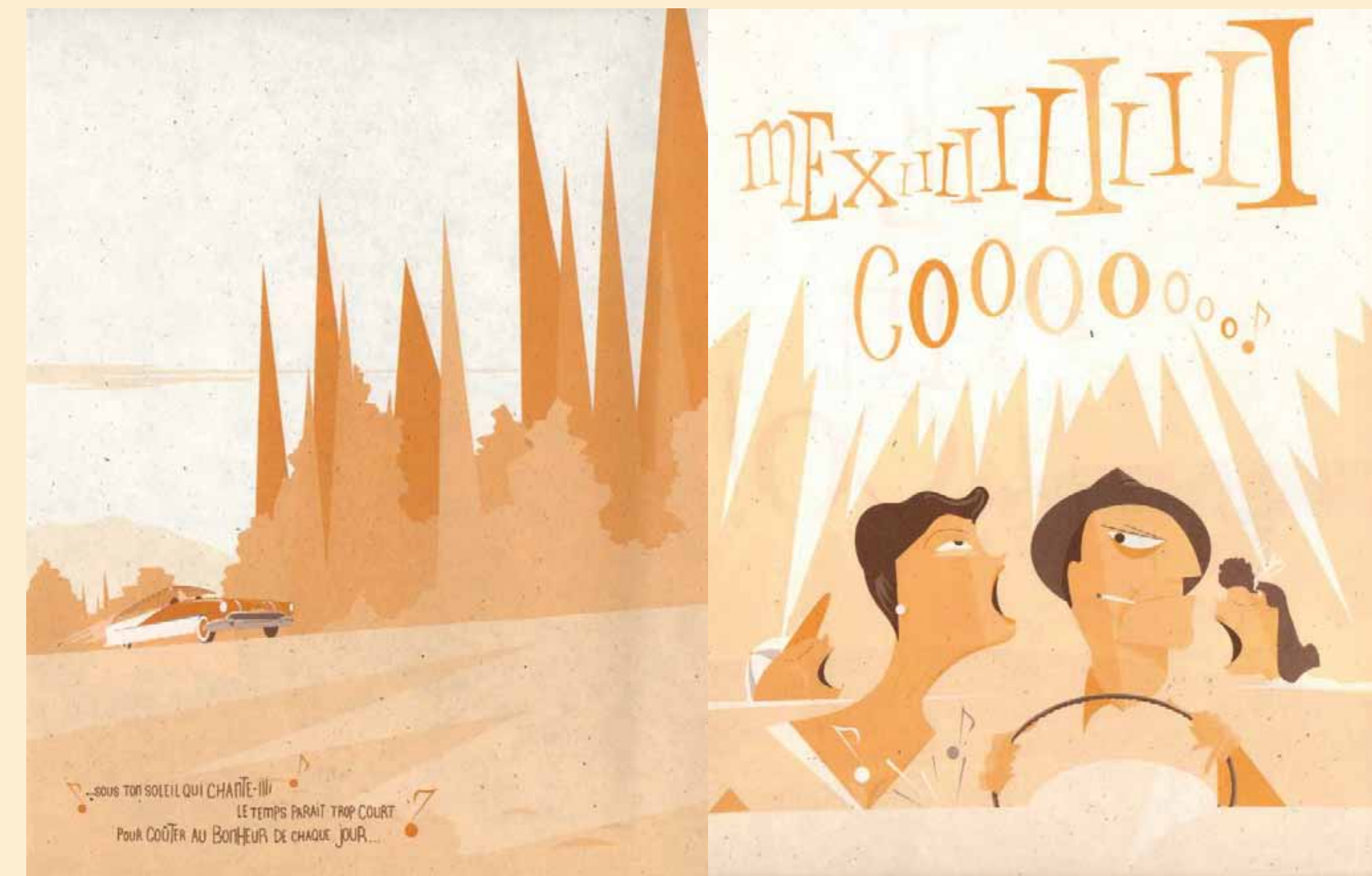
Image 4. Chapitre LA ROUTE, p. 98-109, Scène LA ROUTE, p. 102-104. Discours visuel + Discours littéraire (bande dessinée) + Discours musical Message iconique: une famille voyage dans une voiture. La gestualité du visage de la femme et des enfants suggère une verbalisation. Il y a aussi une rhétorique de la bordure (la bulle) car elle iconise la sonorité (le volume) du contenu. Également, il y a une rhétorisation de la typographie : la taille et la répétition iconisent le style « méliasmatique ». Message musicale: Chanson Mexico, Luis Mariano, 03'32".