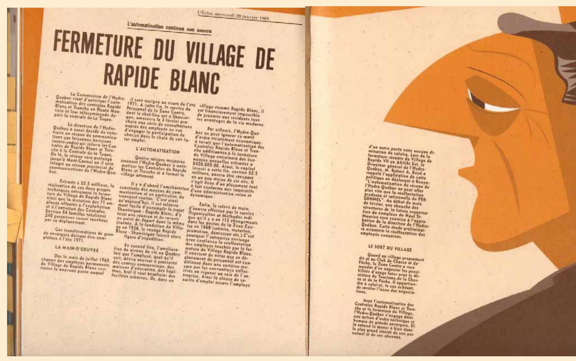
Image 5. Chapitre LES ANNÉES PASSÈRENT, p. 110-119, Scène LA RUMOUR, p. 114-119. Discours visuel + Discours historique (documentaire) + Discours musical Message iconique: un homme qui regarde un texte dont sa configuration spatiale fait penser à celle d'un journal. Message musical: Chanson Tom Dooley, Les compagnons de la chanson, 02'47".