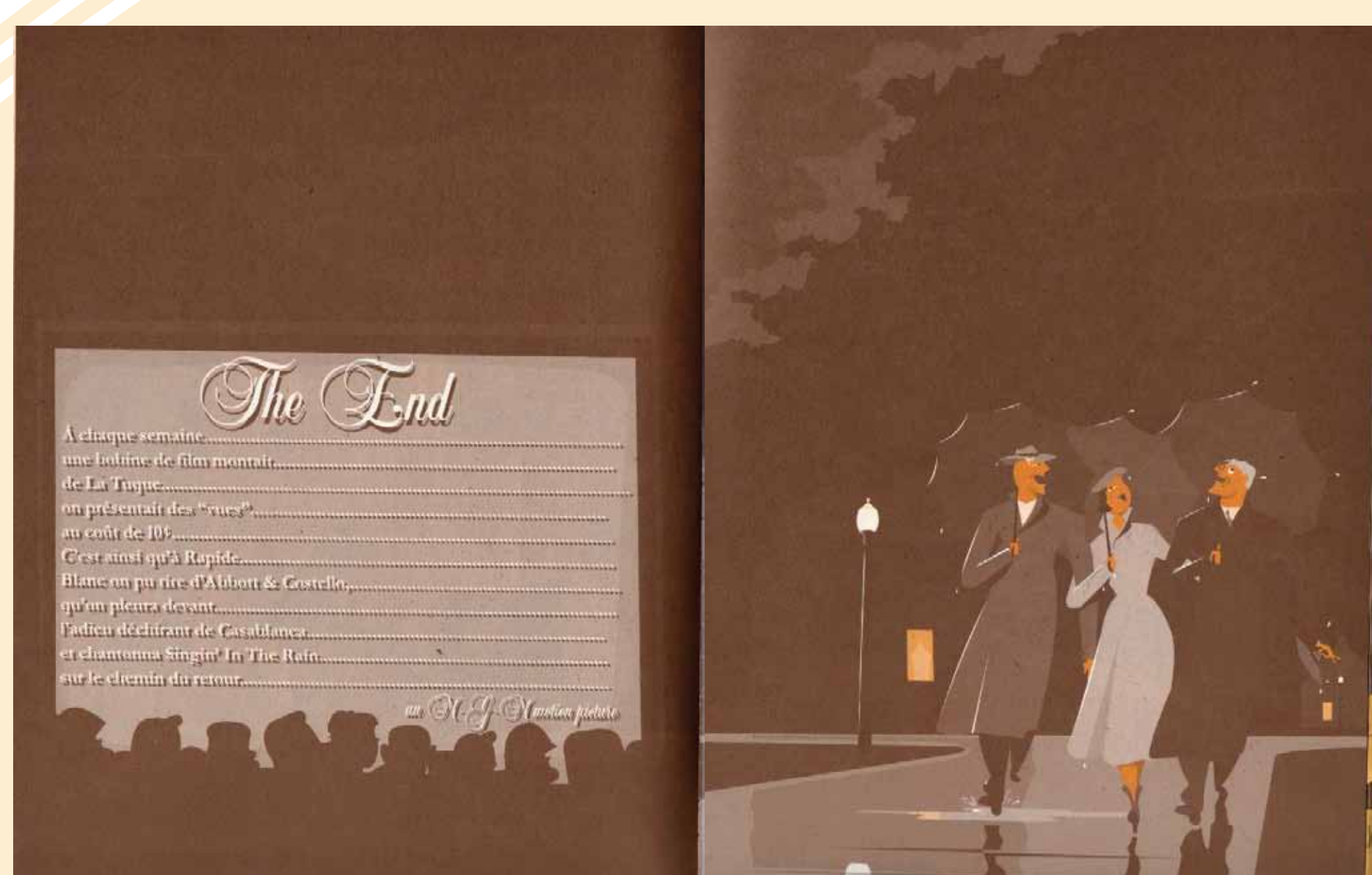
Image 2. Chapitre ALL ABROAD !, p. 40-85, Scène LES VUES, p. 62-63. Discours visuel + Discours audiovisuel (cinématographique) + Discours musical Message iconique: dans une salle de cinéma, l'ombre des têtes des spectateurs qui regardent sur l'écran, ce qui semble être le générique d'un film qui vient de finir. Message musical: Chanson Singin' in the rain, The M-G-M Studio Orchestra, 04'15".

L'objectif de cette communication est de déterminer les dispositifs discursifs qui font de Rapide Blanc une œuvre hybride et intertextuelle. Il s'agit d'examiner la singularité de la relation entre le langage verbal, le langage visuel et le langage musical du texte. L'intervention des plusieurs discours fait qu'on se pose la question de savoir s'il s'agit d'un phénomène de syncrétisme des langages, où chacun maintient sa propre autonomie, ou bien d'un langage syncrétique.