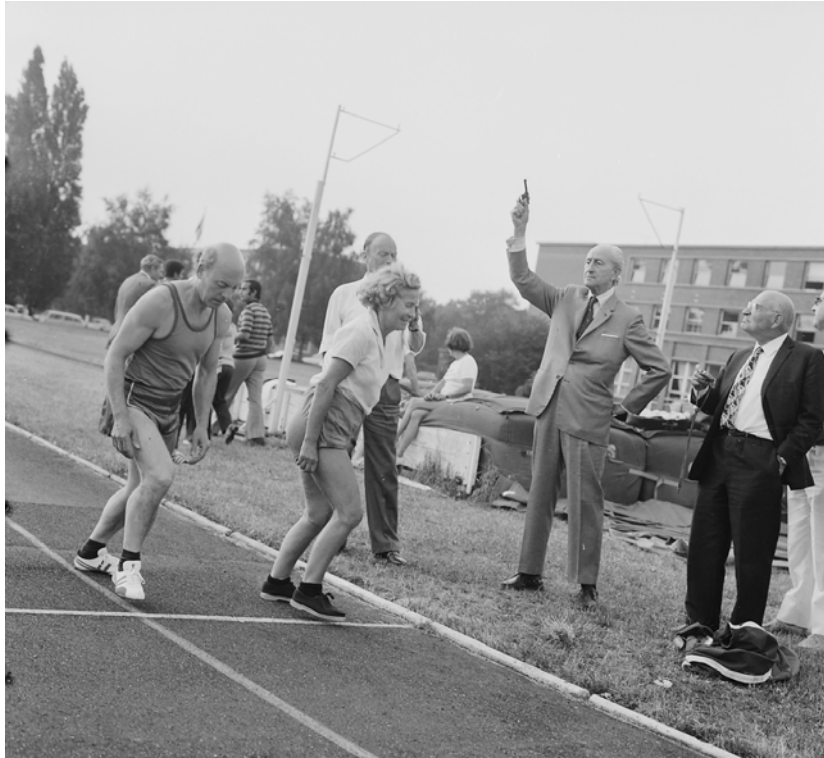
Paul Vialar donne le départ à la fête annuelle des écrivains sportifs INSEP – 1973