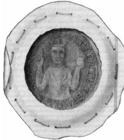
Figure 2 : sceau de Robert le Pieux BNF, nouv. acq. Fr., 8650, fol. 144 v °