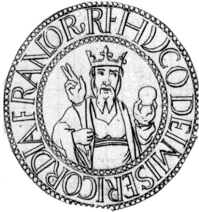
Fig. 1 : sceau d'Hugues Capet MABILLON, De re diplomatica , 1681, p. 421, pl. XXXVIII

imaginer qu'il ait été tenté de restituer par la main bénissante, connue de lui, un objet trilobé que son état pouvait rendre difficilement identifiable 17 .