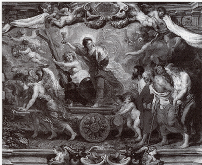
Fig. 4. – Rubens, Le triomphe de la Foi , esquisse pour les tapisseries des Descalzas Reales, Bruxelles, Musées royaux des Beaux-Arts de Belgique, inv. 7442.

roi vainqueur de l'Hérésie 46 . A Limoges comme à Paris, allégories religieuses et réalités politiques se conjuguent pour témoigner de la puissance de l'Église gallicane.