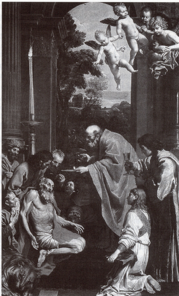
Fig. 2. – Le Dominiquin, La dernière communion de saint Jérôme (1614), musée du Vatican.

On peut toutefois se demander si cette cohérence d'ensemble ponctuelle se retrouve dans l'ensemble, c'est-à-dire si l'ordonnement des éléments décoratifs répond à un plan préétabli. La lecture du texte ne donne pas de réponse évidente, toutefois il semble qu'il faille séparer clairement les théâtres constitués pour l'occasion des éléments décoratifs préexistants, tels les statues ou les tableaux provenant des églises proches du parcours ; ils sont rattachés, parfois d'une manière artificielle, au propos : s'il est évident que saint Dominique ou saint Thomas