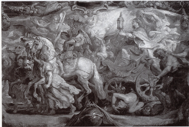
Fig. 3. – Rubens, Le triomphe de l'Église , esquisse pour les tapisseries des Descalzas Reales, Madrid, Musée du Prado, inv. 1698.

représentation sont fort lestement vêtues, et ce char est si bien composé qu'on diroit qu'il va rouler par la ville et qu'il commence à conduire l'Église en triomphe par nos rues. » 42