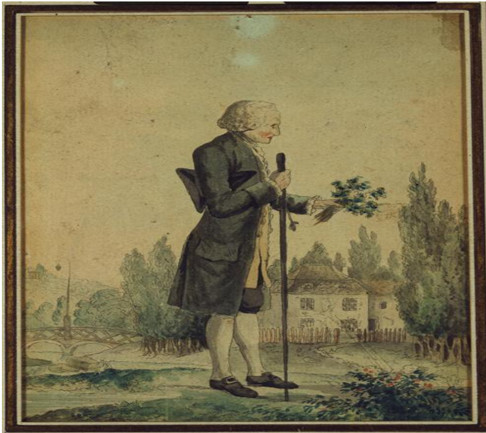
Georges-Frédéric Meyer, Portrait de Jean-Jacques Rousseau, en pied, tenant à la main un bouquet de fleurs, et la vue du Pavillon qu'il habitait à Ermenonville , 1779, Bibliothèque nationale de France.

Son séjour n'y fut pourtant que de six semaines. Mais sa dernière retraite acquiert après sa mort une dimension emblématique et symbolique. Avant son intronisation au Panthéon 554 , le parc devient le lieu où l'on vient rendre hommage au célèbre penseur du siècle des Lumières, dont « l'histoire va se muer en essence 555 ». Une partie du domaine deviendra au 20 e siècle le « Parc Jean-Jacques Rousseau 556 » en raison de la portée symbolique de ce pèlerinage. Le « mythe 557 » est en construction, Ermenonville symbolise alors la retraite comme savoir-vivre ; il devient l'emblème de l'asile heureux.