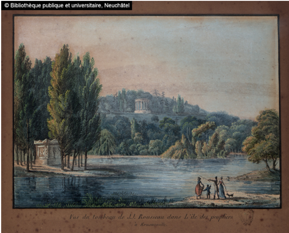
Vue du tombeau de J.-J. Rousseau dans l'île des peupliers à Ermenonville.

« Vue du tombeau de J.-J. Rousseau dans l'île des peupliers », lithographie de Laast, 1825, Bibliothèque universitaire de Neuchâtel.