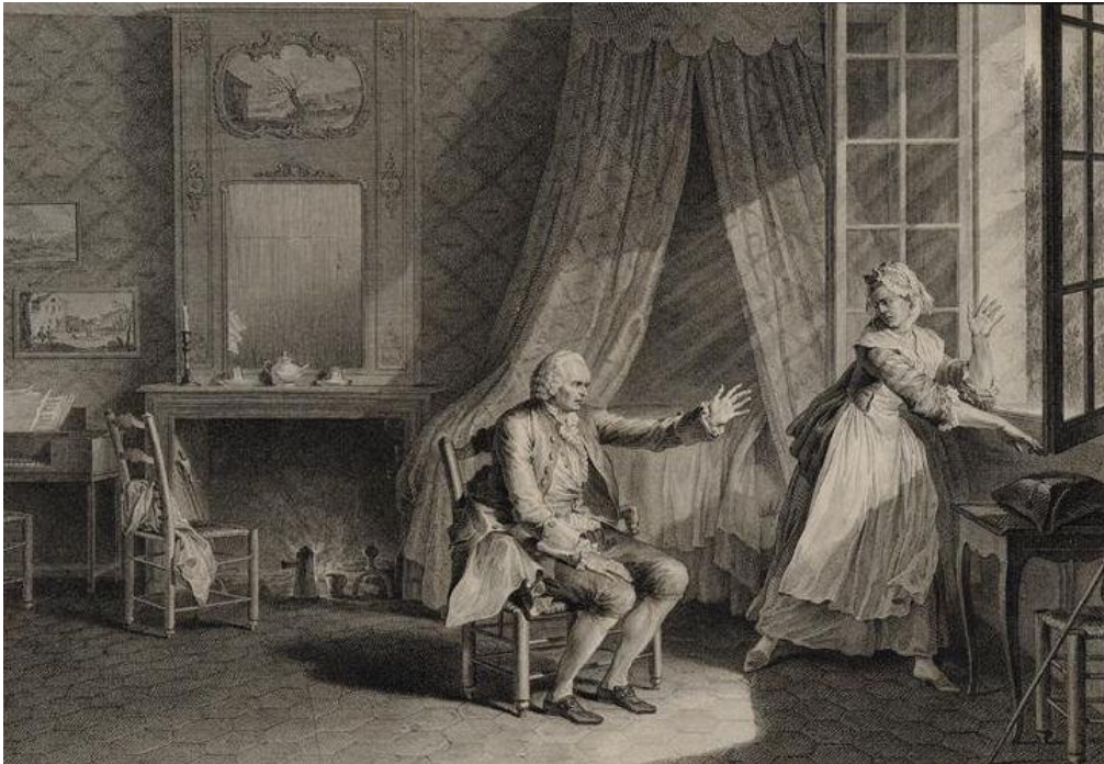
Moreau le jeune, « Les derniers moments de J.-J. Rousseau », gravure sur cuivre, éd. Bozérián, 1801.