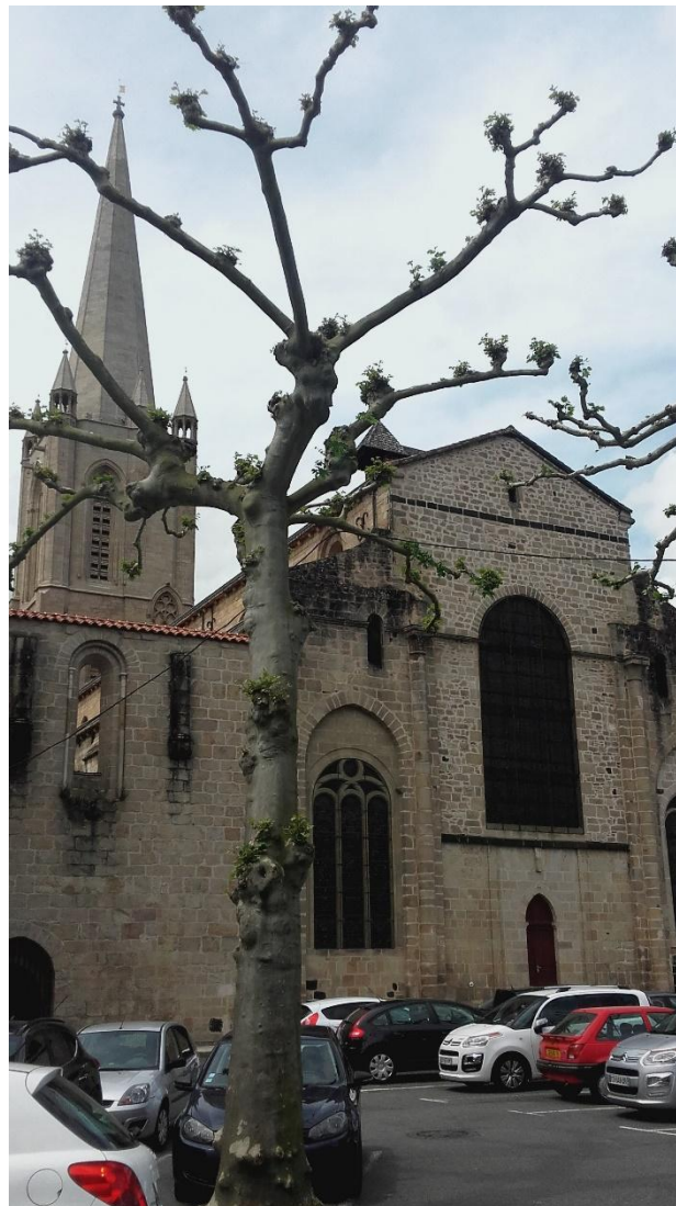
Fig . 2 : Chevet plat de la cathédrale de Tulle depuis l'effondrement en 1796 des chevet et transept médiévaux.

cathédrale, donnant au diocèse une église digne d'être celle du nouveau siège épiscopal et elle abrite toujours la cathèdre de l'évêque de Tulle. En revanche, après Arnaud de Saint-Astier et Arnaud de Clermont, peu d'évêques du XIV e siècle furent vraiment résidents 41 et les fidèles du diocèse de Tulle ne rencontrèrent pas plus leur évêque qu'ils ne devaient rencontrer celui de Limoges avant 1317.