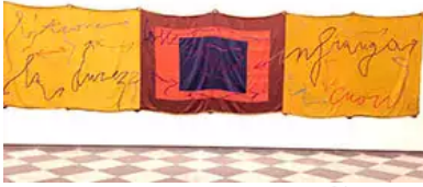
Fig. 9. M. Nereo Rotelli, Presente, 2004