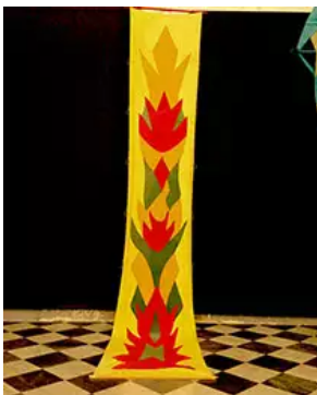
Fig. 15. G. Turcato, Presente, 1989

de Renata Boero (fig. 10), en passant par l'hybridation entre tissage et collage du Presente d'Isabella Ducrot (figs. 11 et 12). A ceux-ci s'ajoutent des presenti plus traditionnels, tels ceux de Pietro Consagra (figs. 13 et 14) qui reprend les anciens motifs à épine de blé et l'utilisation du velours, de Giulio Turcato (fig. 15).