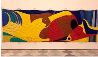
Fig. 10. R. Boero, Presenti, 1992