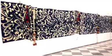
Figs. 5 à 7. N. Mahdaoui, Presenti, 1993