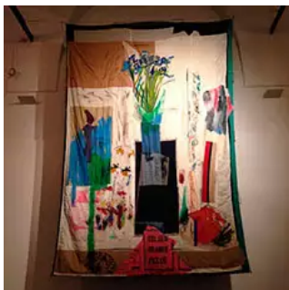
Fig. 11. I. Ducrot, Prisentì, 1991