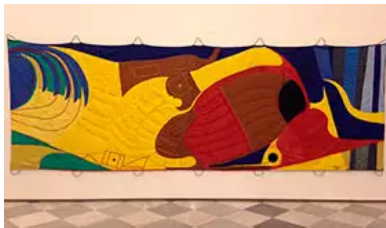
Fig. 10. R. Boero, Prisentì, 1992