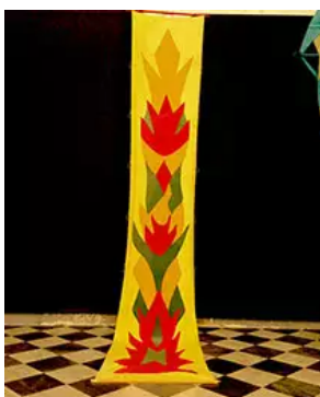
Fig. 15. G. Turcato, Prisentì, 1989

de Renata Boero (fig. 10), en passant par l'hybridation entre tissage et collage du Prisentì de Isabella Ducrot (figs. 11 et 12). A ceux-ci s'ajoutent des prisenti plus traditionnels, tels ceux de Pietro Consagra (figs. 13 et 14) qui reprend les anciens motifs à épine de blé et l'utilisation du velours, de Giulio Turcato (fig. 15).