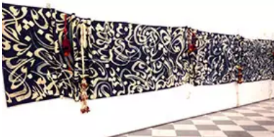
Figs. 5 à 7. N. Mahdaoui, Presenti, 1993