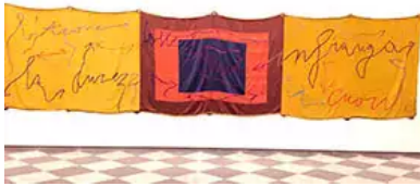
Fig. 9. M. Nereo Rotelli, Prisente, 2004