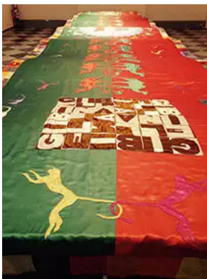
Figs. 1 à 4. Al. Boetti, Presenti, 1985