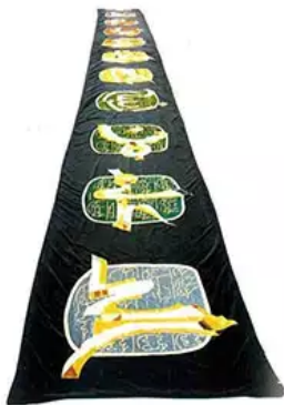
Fig. 8. S. Burhan, Presenti, 1986