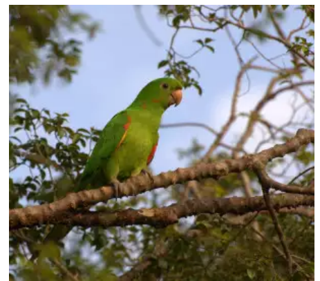
Conure pavouane, Psittacara leucophthalmus

Dans un environnement où, par exemple, un individu Runa peut devenir Runa puma [6] (homme-jaguar), et où il est conseillé de « dormir sur le dos » afin de pouvoir soutenir le regard d'un jaguar et, ainsi, ne pas être pris pour une proie potentielle, ou, encore, dans lequel les Runa fabriquent un type particulier d'épouvantail en cherchant à reproduire « ce à quoi un rapace ressemble du point de vue d'une conure » [7] (Kohn 2017: 128), on constate non seulement qu'il y a une sorte de réversibilité des places éventuellement occupées par les humains et les non-humains [8], mais que ces différents êtres vivants ne sont pas constitués en tant que tels à l'avance : les sois émergent du processus sémiotique même. A l'instar des interactants, le soi « c'est le lieu – quelque rudimentaire et éphémère qu'il soit – d'une dynamique vivante par laquelle les signes en viennent à représenter le monde autour d'eux pour un "quelqu'un" qui émerge en tant que tel à l'issue de ce processus » (Kohn 2017: 40).