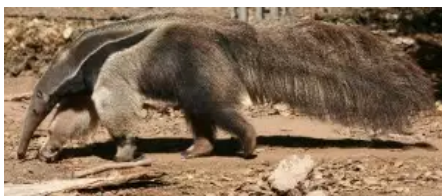
Tamanoir fourmillier géant

En d'autres termes, cela reviendrait à chercher des logiques générales de la pensée et de l'action qui puissent garantir, sinon une réversibilité qui est peut-être impossible à atteindre définitivement, au moins un déplacement partiel du point de vue, de la perspective d'un agent humain sur un non-humain et inversement.