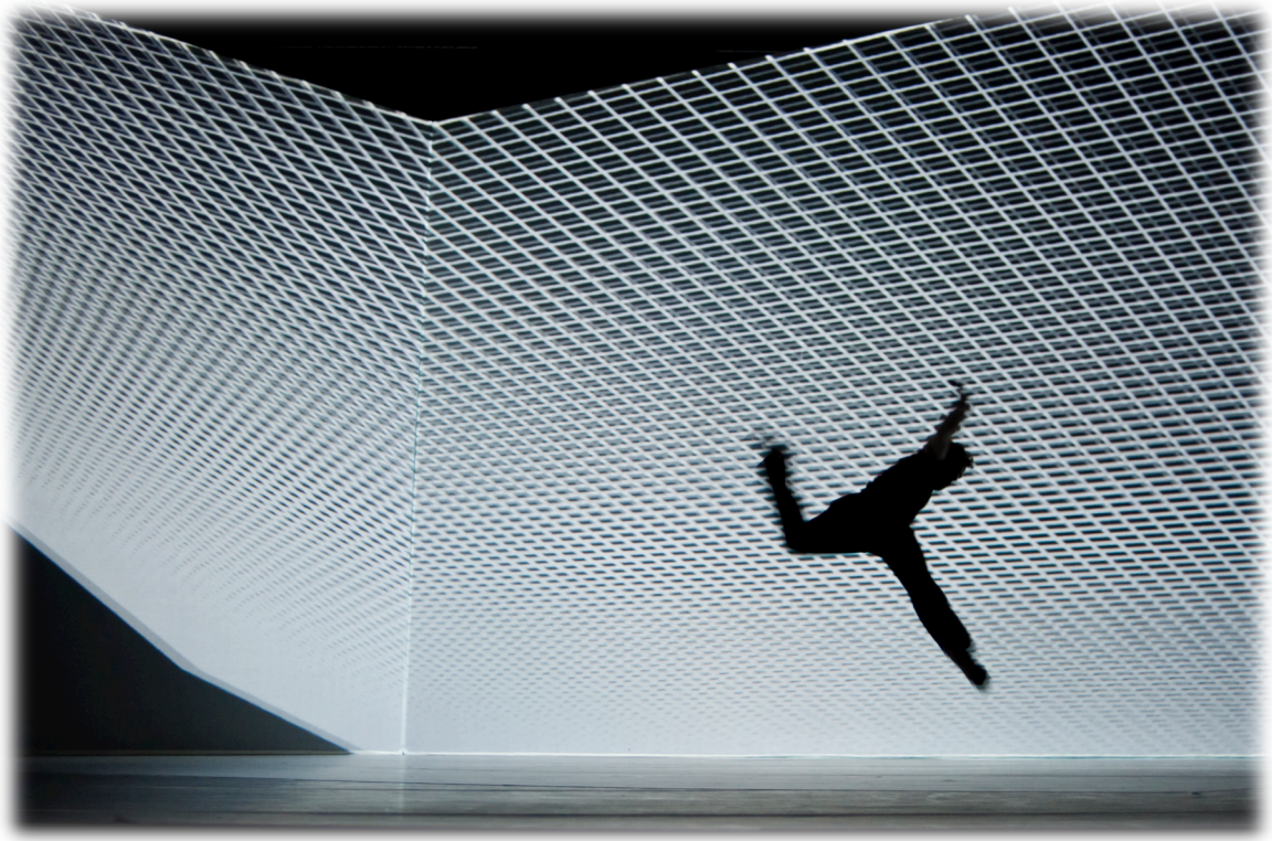
Fig. 1 : images-atmosphères et lexicalisations : "bascules"

Plus particulièrement, comme on cherchera à le montrer, l'idée et l'analyse d'images-atmosphères nous permettra de considérer autrement le rôle artistique et créatif du numérique en danse à travers l'hypothèse d'une figuralité proprement numérique qui, bien qu'elle ne soit certes totalement nouvelle sous un profil technique, tient ensemble plusieurs suggestions théoriques et pratiques issues des études chorégraphiques. En d'autres termes, la figuralité numérique que certaines images-atmosphères permettent de mettre en exergue, s'éloigne de la reconstitution visuelle du mouvement en tant que tel, pour se concentrer sur l'interaction entre plusieurs forces et matières qui animent et produisent le mouvement, aussi bien de l'extérieur que de l'intérieur, ainsi qu'aux frontières entre les espaces.