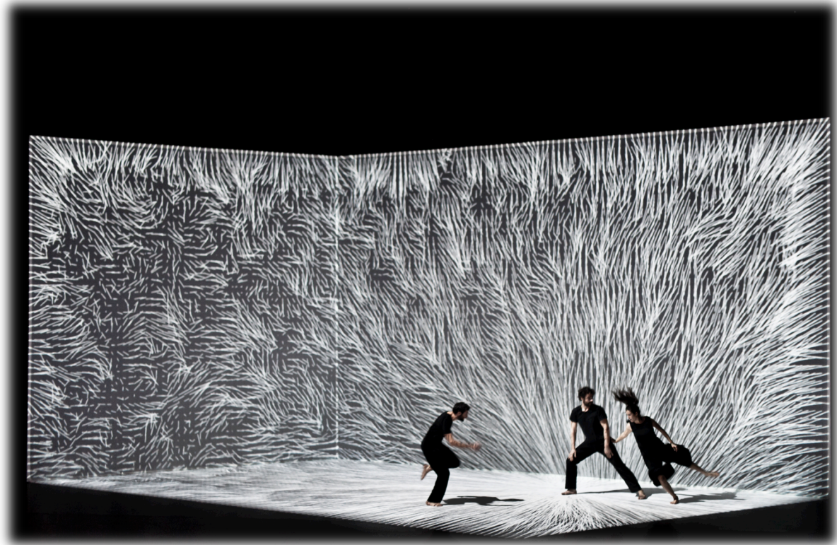
Fig. 3 : images-atmosphères et lexicalisations : "vecteurs"

Dans ce cadre, la production même d'atmosphères en littérature, en architecture ou dans le design contribue à diffuser l'artistique dans la vie ordinaire.