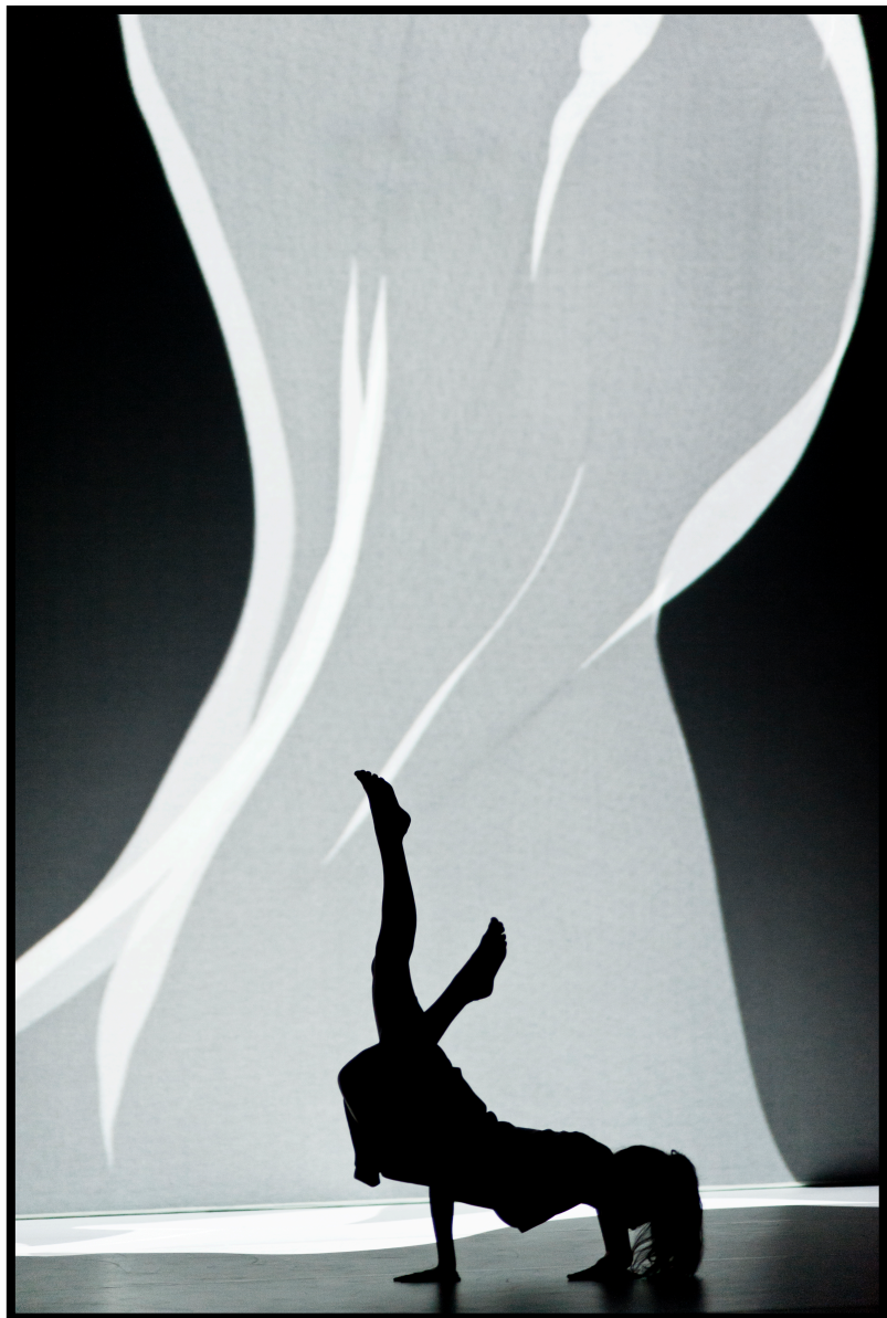
Fig. 4 : images-atmosphères et lexicalisations : "voile"

sont d'abord des espaces [...] Elles sont des sphères de présence de quelque chose, qui est peut-être invisible : elles marquent la réalité de cette chose dans l'espace [...] nous concevons donc l'atmosphère non pas comme un phénomène flottant librement, mais au contraire comme procédant des choses, des personnes et de leurs constellations [...] L'atmosphère est la réalité commune au percevant et au perçu : elle est la réalité du perçu comme sphère de sa présence, et elle est la réalité du percevant puisque, en ressentant l'atmosphère, celui-ci est présent corporellement d'une manière spécifique. (Böhme 2018 : 35-36)