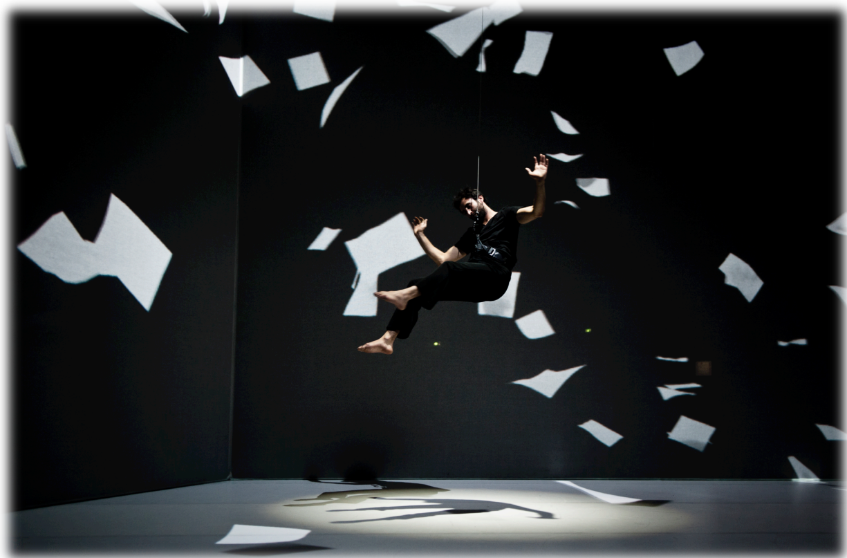
Fig. 2 : images-atmosphères et lexicalisations : "feuilles"

affichée par les artistes peut se doter d'outils conceptuels et méthodologiques qui sont à même de thématiser et d'élargir le spectre aussi bien des différents dispositifs techniques employés que des matériaux expressifs auxquels on fait appel, tout comme des modalités de leur médiatisation.