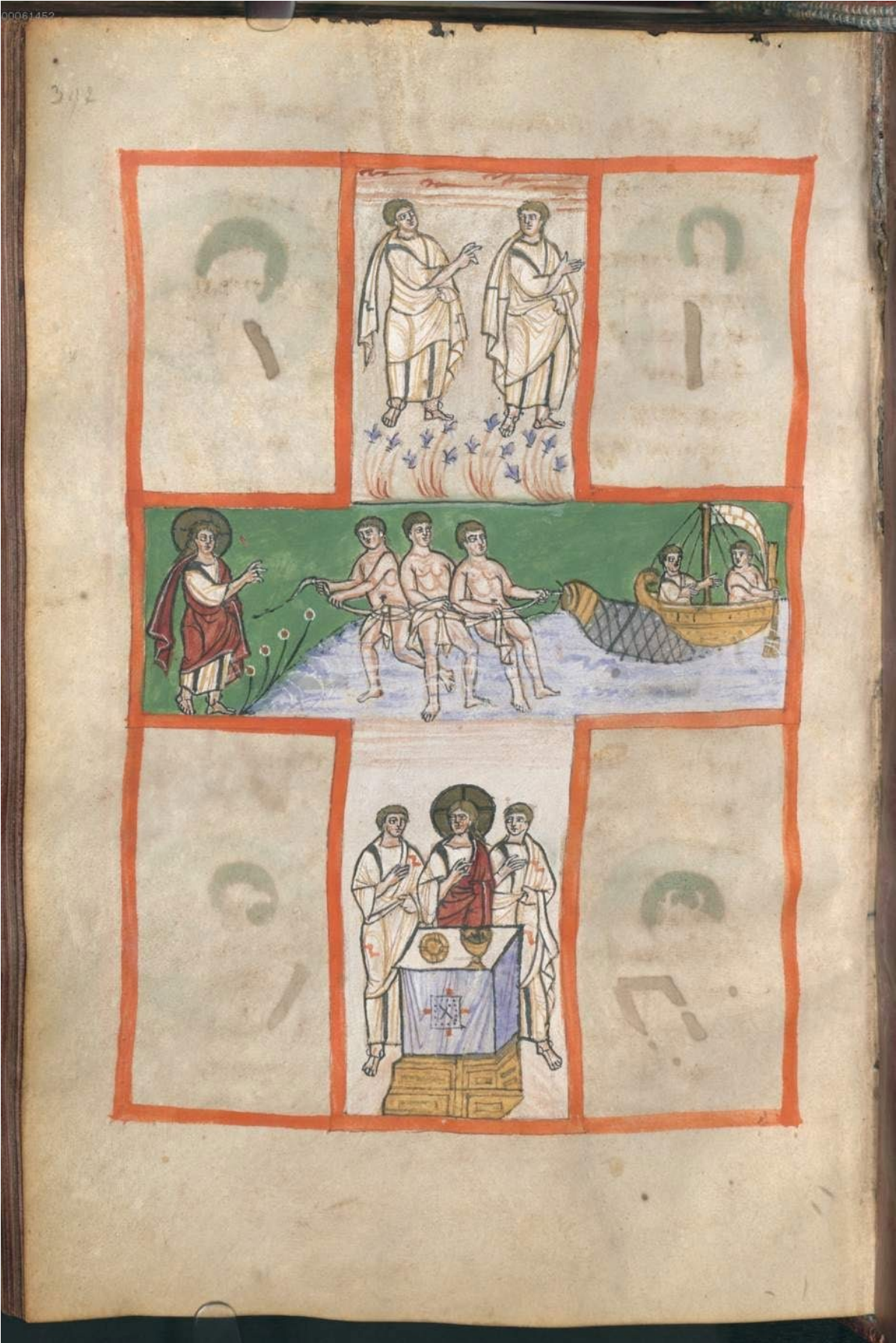
Figure 3: Codex Purpureus , Augsburg, fol. 197 v, parchemin, Munich, Bayerisches Staatsbibliothek, IX e siècle