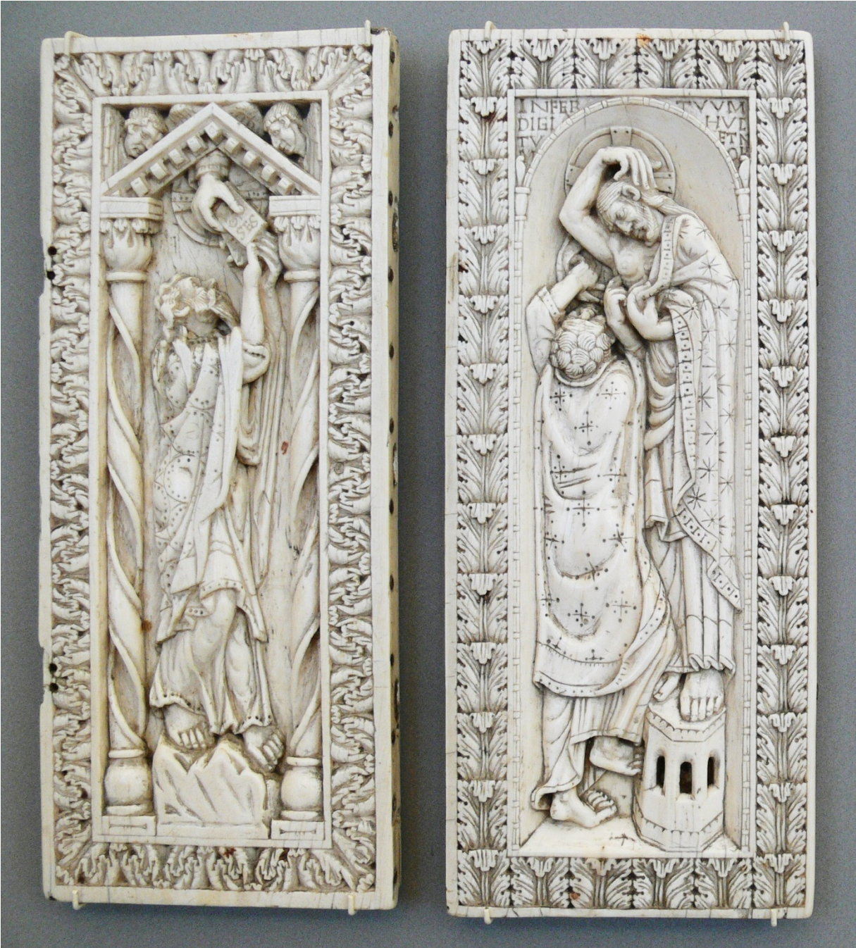
Figure 1: Diptyque dit du "Maître d'Echternach", ivoire, Berlin, Staatliche Museen, X e siècle