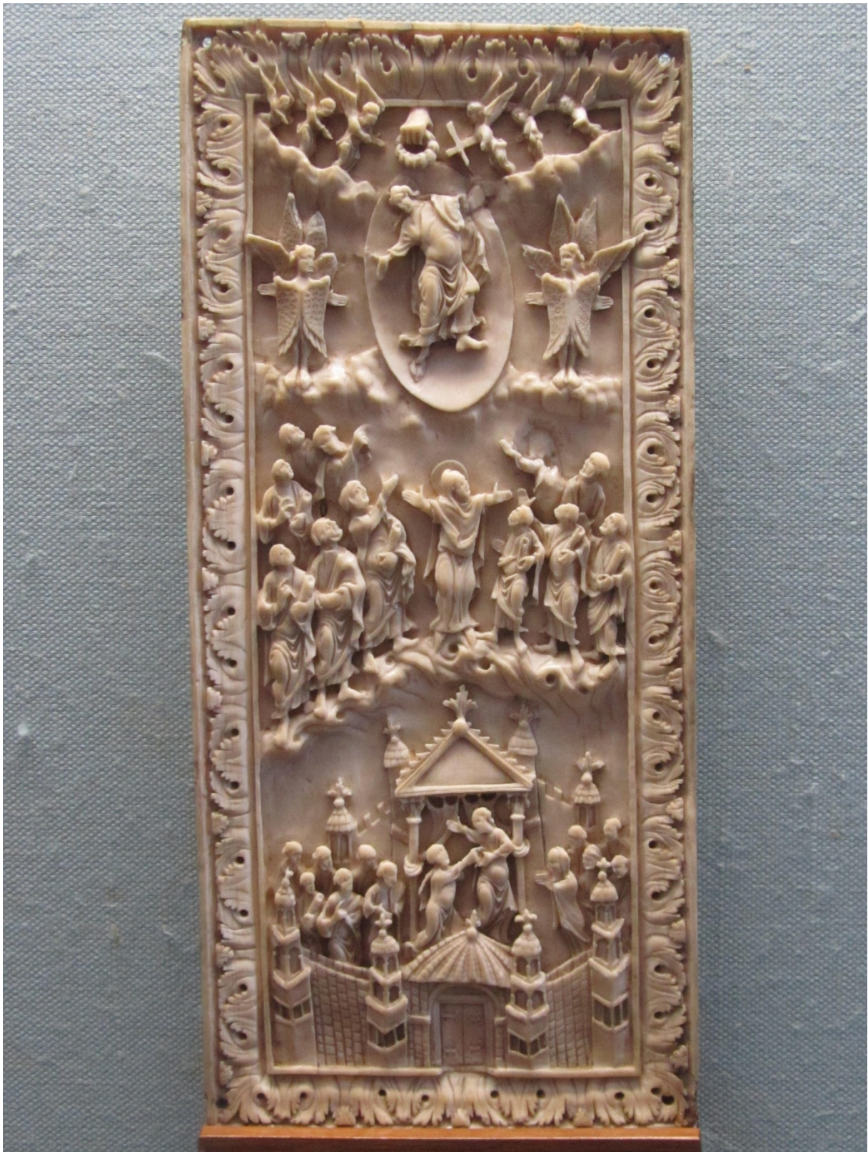
Figure 4: Plaque de l'Ascension , ivoire, Weimar, Musée d'Art, IX e ou fin X e siècle