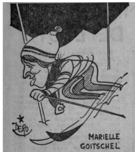
Fig. 3 – Caricature de Dero L'Équipe (15 février 1964)