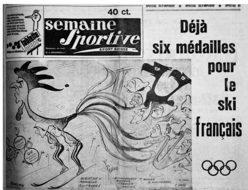
Fig. 4 – Caricature de Pellos Semaine Sportive (4 février 1964)