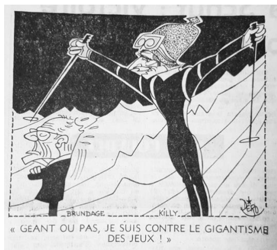
Fig. 10 – Caricature de Dero L'Équipe (13 février 1968)