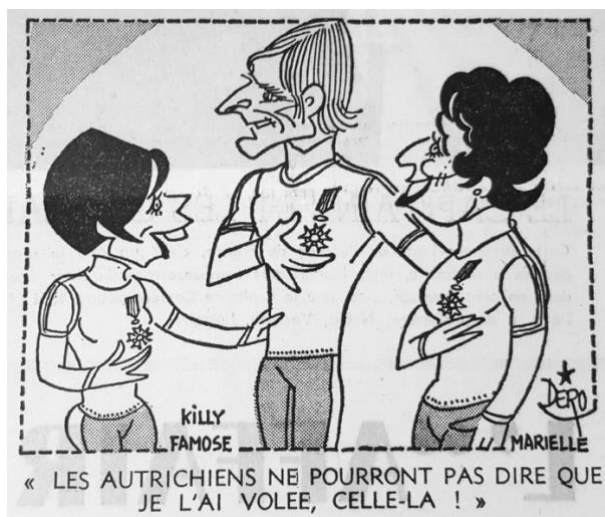
Fig. 11 – Caricature de Dero L'Équipe (23 février 1968)