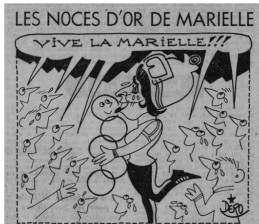
Fig. 2 – Caricature de Dero L'Équipe (14 février 1968)