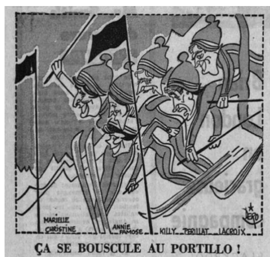
Fig. 1 – Caricature de Dero L'Équipe (5 août 1966)