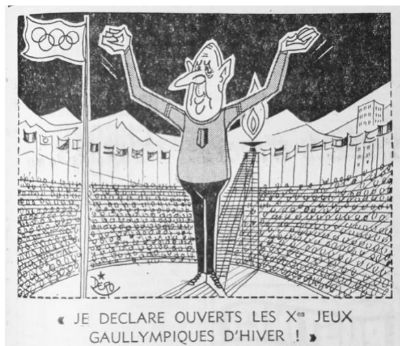
Fig. 8 – Caricature de Dero L'Équipe (6 février 1968)