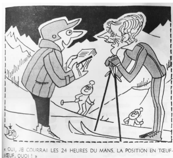
Fig. 9 – Caricature de Dero L'Équipe (26 janvier 1968)