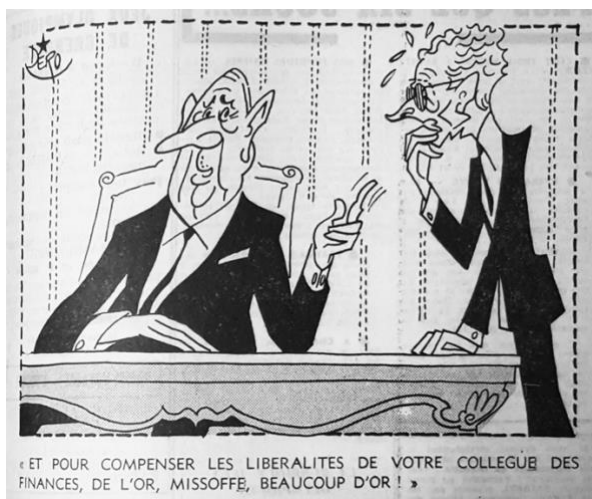
Fig. 7 – Caricature de Dero L'Équipe (31 janvier 1968)