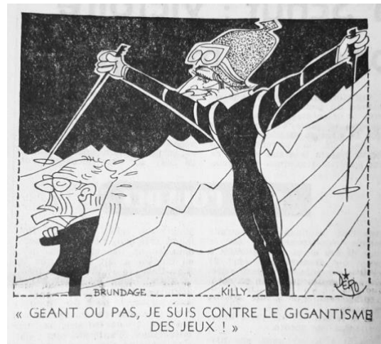
Fig. 10 – Caricature de Dero L'Équipe (13 février 1968)