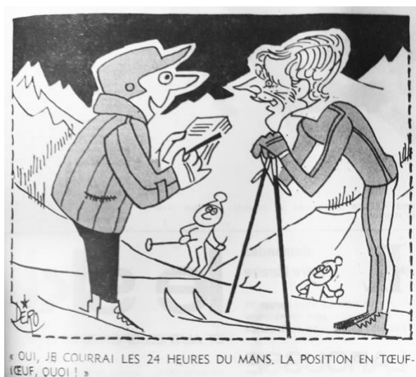
Fig. 9 – Caricature de Dero L'Équipe (26 janvier 1968)