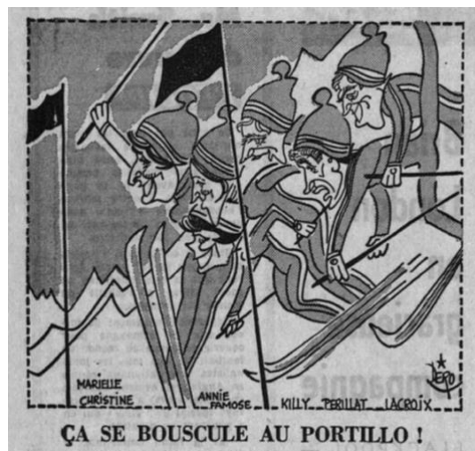
Fig. 1 – Caricature de Dero L'Équipe (5 août 1966)