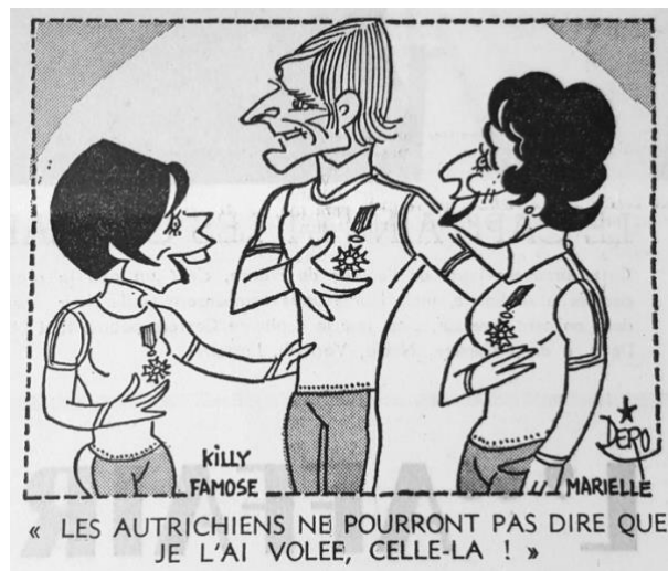
Fig. 11 – Caricature de Dero L'Équipe (23 février 1968)