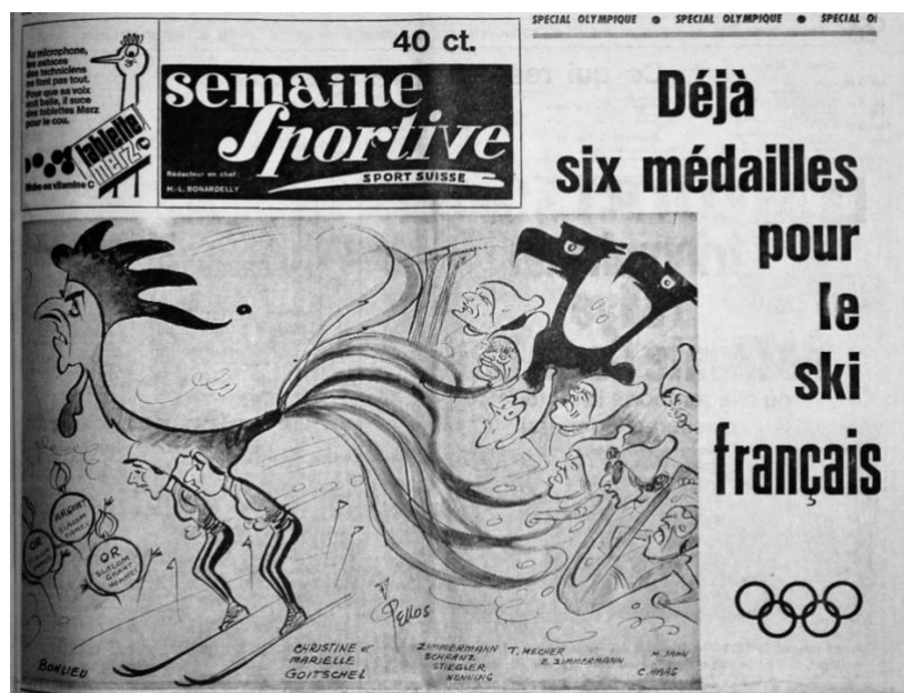
Fig. 4 – Caricature de Pellos Semaine Sportive (4 février 1964)