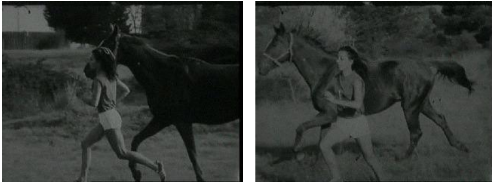
Fig. 5 – « Médaille d'or de charme », reportage diffusé le 13 novembre 1968 sur la première chaîne Archives de l'INAthèque

de Marielle Goitschel. D'ailleurs, la belle blonde aux yeux bleus, laissant peu à peu pousser ses cheveux, se maquillant et prenant pour modèle une certaine Brigitte Bardot, finira par épouser une carrière d'actrice. Celle qui n'était qu'une enfant sage, parfois un peu naïve, devient rapidement un objet de désir en jouant sur les idéaux féminins. À contre-courant des représentations de la sportive masculine, Christine Caron est élevée au rang de sex-symbol.