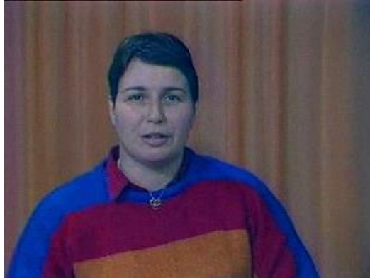
Fig. 6 – « Plateau Marielle Goitschel », reportage diffusé le 20 février 1984 sur Antenne 2 Archives de l'INAthèque