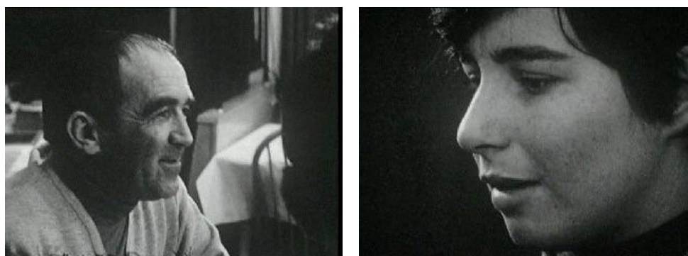
Fig. 2 – « Les demoiselles de Grenoble », reportage diffusé le 2 février 1968 Archives de l'INAtèque

lecture de l'information par les téléspectateurs. Cette stratégie lui permet de « jouer plus facilement sur les affects et de capter l'attention en présentant des supports d'identification reposant sur la projection et l'empathie » (Ghosn, 2002 : 5). Bien entendu, à l'instar de ce journaliste, la plupart des acteurs médiatiques choisissent avec soin ces poncifs pour s'emparer d'une nouvelle réalité. Mais, au final, Marielle Goitschel n'est qu'une victime parmi d'autres de ce système. Un cercle vicieux qui enferme son personnage dans un cadre bien défini et imposé par la domination masculine.