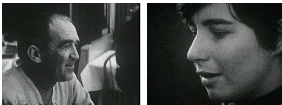
Fig. 2 – « Les demoiselles de Grenoble », reportage diffusé le 2 février 1968

lecture de l'information par les téléspectateurs. Cette stratégie lui permet de « jouer plus facilement sur les affects et de capter l'attention en présentant des supports d'identification reposant sur la projection et l'empathie » (Ghosn, 2002 : 5). Bien entendu, à l'instar de ce journaliste, la plupart des acteurs médiatiques choisissent avec soin ces poncifs pour s'emparer d'une nouvelle réalité. Mais, au final, Marielle Goitschel n'est qu'une victime parmi d'autres de ce système. Un cercle vicieux qui enferme son personnage dans un cadre bien défini et imposé par la domination masculine.