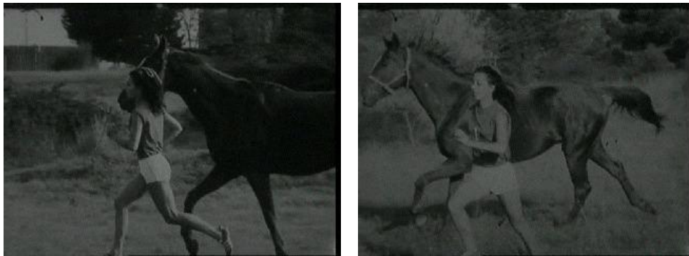
Fig. 5 – « Médaille d'or de charme », reportage diffusé le 13 novembre 1968 sur la première chaîne

de Marielle Goitschel. D'ailleurs, la belle blonde aux yeux bleus, laissant peu à peu pousser ses cheveux, se maquillant et prenant pour modèle une certaine Brigitte Bardot, finira par épouser une carrière d'actrice. Celle qui n'était qu'une enfant sage, parfois un peu naïve, devient rapidement un objet de désir en jouant sur les idéaux féminins. À contre-courant des représentations de la sportive masculine, Christine Caron est élevée au rang de sex-symbol.