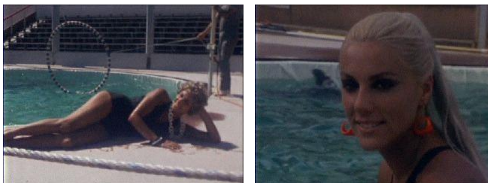
Fig. 4 – « Kiki et les dauphins », reportage diffusé le 18 juillet 1969 sur la deuxième chaîne Archives de l'INAthèque

Caron, vice-championne olympique en 1964, et l'athlète Colette Besson, championne olympique en 1968.