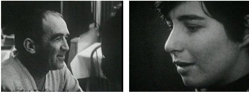
Fig. 2 – « Les demoiselles de Grenoble », reportage diffusé le 2 février 1968

lecture de l'information par les téléspectateurs. Cette stratégie lui permet de « jouer plus facilement sur les affects et de capter l'attention en présentant des supports d'identification reposant sur la projection et l'empathie » (Ghosn, 2002 : 5). Bien entendu, à l'instar de ce journaliste, la plupart des acteurs médiatiques choisissent avec soin ces poncifs pour s'emparer d'une nouvelle réalité. Mais, au final, Marielle Goitschel n'est qu'une victime parmi d'autres de ce système. Un cercle vicieux qui enferme son personnage dans un cadre bien défini et imposé par la domination masculine.