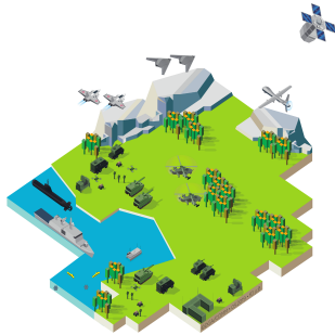
Figure 1. Illustration d'environnement complexe pour les communications terrestres.

La propagation horizontale d'ondes radioélectriques à la surface du sol est sujette à de nombreuses perturbations liées à l'environnement terrestre, comme illustré sur la figure 1. La végétation, le taux d'humidité, la nature du sol et le relief introduisent des phénomènes de rétrodiffusion, d'absorptions et de dispersion sur le rayonnement électromagnétique qui vont impacter le bilan de liaison entre des objets communicants (véhicules, infrastructures) ou des couples d'émetteur – récepteur. La prédiction du rayonnement dans le contexte de communications terrestres n'est pas maîtrisée et nécessiterait une prise en compte rigoureuse de l'environnement sur des distances importantes. Par exemple, l'intégrale de Sommerfeld peut être utilisée pour traiter les différentes ondes de sol et de surface mais elle reste limitée à des sols homogènes voire stratifiés et lisses en surface.