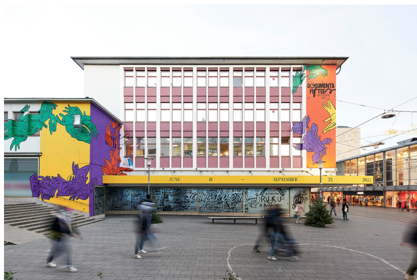
Fig. 1 – Documenta fifteen, ruruHaus, 2020, (© Nicolas Wefers), www.documenta-fifteen.de/en/press-releases/documenta-fifteen-presents-visual-identity/ .

Per rispondere a queste domande, il collettivo adotta un principio metodologico che sostiene il lavoro in seno al lumbung : una “interazione partecipativa” attenta al coinvolgimento attivo delle comunità locali. L’obiettivo esplicito del progetto curatoriale 17 è “creare una piattaforma d’arte e cultura interdisciplinare, cooperativa e orientata al mondo”, in grado di superare potenzialmente il limite dei 100 giorni che sancisce la durata di Documenta 15 . Il superamento del limite temporale dei 100 giorni si spiega richiamando l’ambiziosa volontà di mettere in campo un “diverso tipo di modello collaborativo delle risorse (economiche), ma anche di idee, conoscenze, programmi e innovazione”.