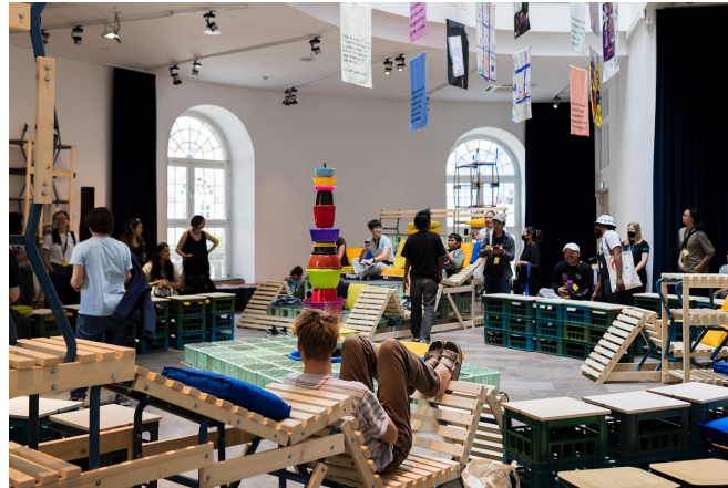
Fig. 4 – Fridskul Common Library, Fridericianum, Kassel, 2022. (© Victoria Tomaschko). www.kunstkritikk.com/learning-from-documenta-15/ .