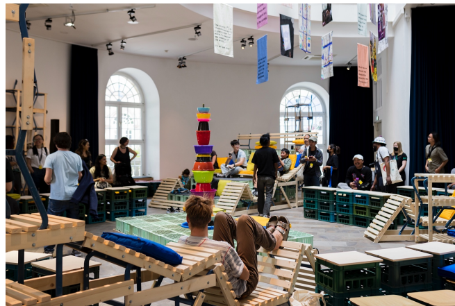
Fig. 4 – Fridskul Common Library, Fridericianum, Kassel, 2022. (© Victoria Tomaschko). www.kunstkritikk.com/learning-from-documenta-15/ .