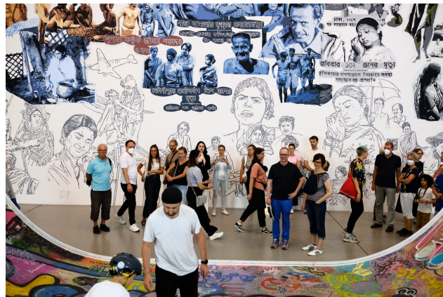
Fig. 5 – Keleketla! Library's concert, part of their event series 'Skaftien' (2011–), at documenta fifteen, Kassel.