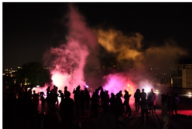
Fig. 2 – Keleketla! Library's concert, part of their event series Skaftien (2011–), at documenta fifteen, Kassel. Courtesy Iswanto Hartono www.artreview.com/who-is-exploiting-who-ruangrupa-on-documenta-fifteen/ .