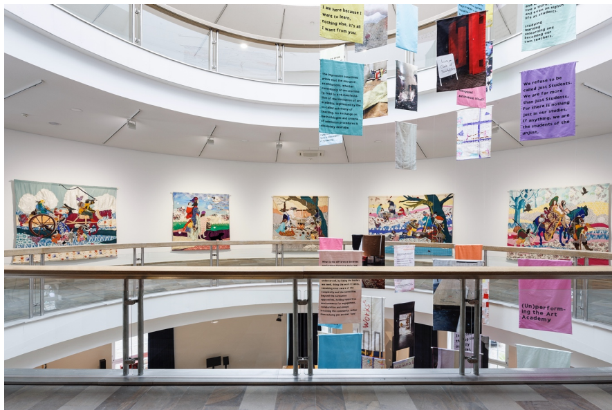
Fig. 2 – Foundation Class Collective, Becoming , 2022, Małgorzata Mirga-Tas, from the series Out of Egypt , 2021. Installation view, Fridericianum, Kassel, 2022. Pho (© Frank Sperling). www.kunstkritikk.com/learning-from-documenta-15/ .

Rispetto al primo punto, vale a dire l'istituzione di un codice-lingua condiviso, Ruangrupa ha svolto un'azione pedagogica fondamentale per educare il futuro pubblico della manifestazione a una lingua-codice da praticare insieme. Il collettivo ha stilato sul sito di Documenta un glossario di termini principalmente indonesiani 19 , cui si aggiungono alcuni lessemi che hanno la forma di micro-sintagmi alla cui testa figura proprio il lumbung- ( lumbung artists , lumbung konteks , lumbung values , ecc.). In altre parole, lumbung diventa la qualità semantico-pragmatica che istituisce i referenti del lumbung -mondo, ovvero quella nicchia linguistico-oggettuale-estetica della quale è possibile divenire i “parlanti”. La mediazione tecnologica (le diverse sezioni del sito internet) possiede anche un valore “programmatore”, in quanto alcuni dei termini presenti nel glossario sono anche delle categorie-filtro per la ricerca tematica degli eventi su tutto il calendario della manifestazione. Inoltre, l'istituzione linguistica coinvolge financo il luogo fisico stesso di Documenta 15 , ovvero il museo Fridericianum che ospita l'evento. Quest'ultimo, nella situazione performativa di Ruangrupa si muta in Fridskul 20 , ovvero il Fridericianum as School , un luogo nel